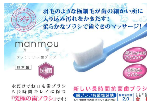
万毛プラチナノ歯ブラシ