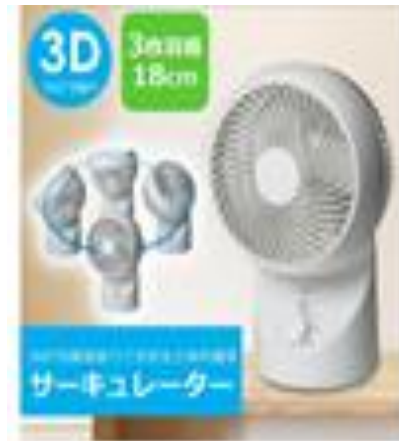
サーキュレーター