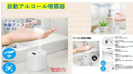
自動アルコール噴霧器