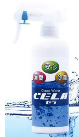
セラ水(次亜塩素酸水)