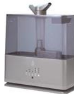
ジアフィン次亜塩素酸水 噴霧器