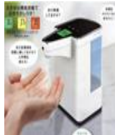
温度計付き非接触 ハンドスプレー