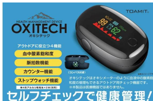
血中濃度検査キット