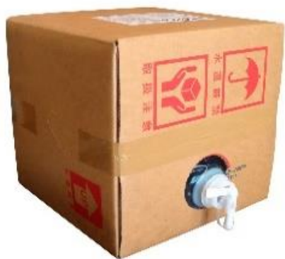
ジアフィン次亜塩素酸水(200)